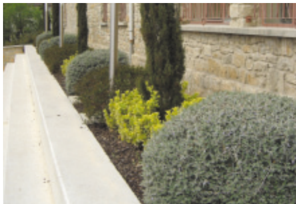
Zona de jardines.

corporaciones municipales por unanimidad han respaldado y potenciado tanto la mejora de las zonas verdes, como las campañas que desde el Área se han propuesto. Además, el Ayuntamiento ha sido clave al liderar los cambios dando protagonismo y competencias al Área de Jardinería y Agenda 21, firmando a su vez la carta de Aalborg.