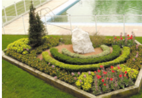
Ajardinamiento de zonas públicas.