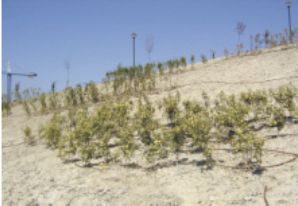
Sistema de riego por goteo.