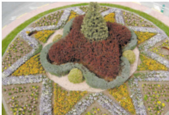
Ajardinamiento de rotondas.