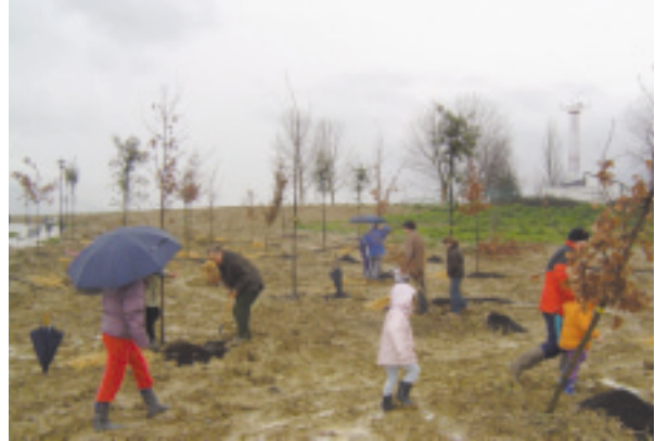
Campaña de "Hermano árbol" 2004.