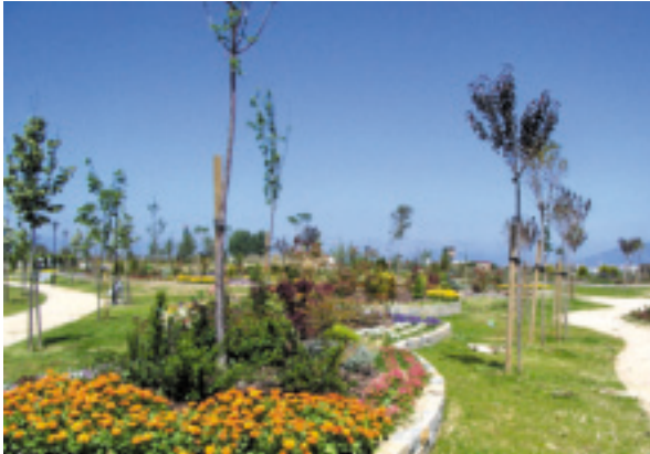
Parque de los sentidos.